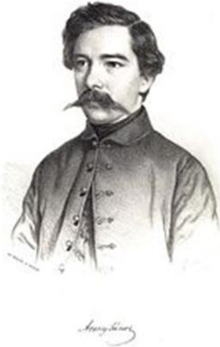
Arany János költő